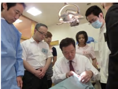
実際の診療台でインプラント 植立の説明

今まで頭で思っていたことだけでなく、実際のインプラント治療の現場で先生方が何に悩んでおられるのか？大分明らかになってきました。これからの講習会にこの情報を活かしたいと思っています。