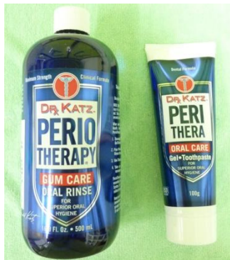
写真4： 新しい 口臭治療 グッズ 『ペリオ セラピー』