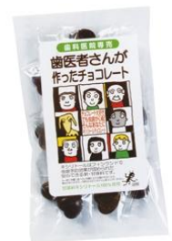
歯医者さんが作ったチョコレート (20粒) 1,050円(税込)