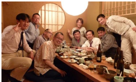
写真1：8日の懇親会にて