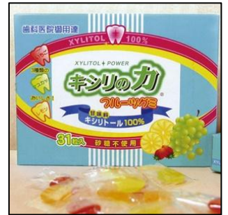
キシリのカフルーツガム 1,050円(税込)