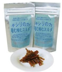
キシリのカ 噛む噛むスルメ 370円(税込)