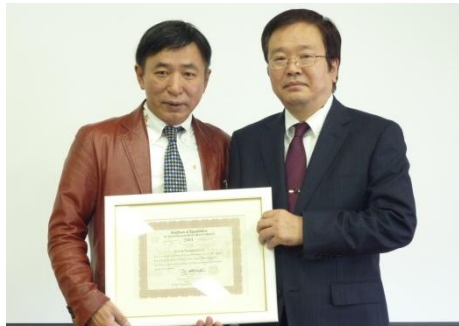
写真2：認定証を頂きました