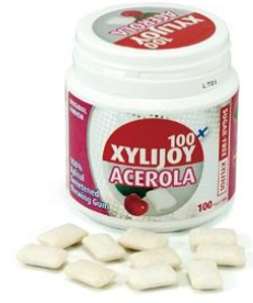
キシリジョイ 100 840円(税込)

妊婦さんにとって、貴重な情報があります。キシリトールは、妊娠中のお母さんが摂取すると、生まれてくる赤ちゃんのむし歯予防対策に非常に有効だということが最近の研究でわかりました。現在、むし歯は〈ミュータンス菌という原因菌が口の中に移り増殖し、むし歯を起こす〉ということがわかっています。むし歯は 感染症 なのです。生まれたての赤ちゃんのお口の中には、ミュータンス菌はいません。周りの大人が唾液を介して、移してしまうのです。お母さんにむし歯が多いと、当然赤ちゃんもむし歯が多くなるという研究も報告されています。赤ちゃんのむし歯対策には、周りの大人のむし歯予防が非常に重要になってきます。その中でもお母さんが一番大切です。最近、岡山大学の仲井雪絵先生が、妊娠中のお母さんが、キシリトールを摂取すると赤ちゃんの虫歯菌が減少するという研究結果を発表されました。妊娠6ヶ月から出産後9ヶ月間、1日平均3個のガムを噛んでもらい、その後ミュータンス菌の量を測定するとお母さんの菌の量が減少し、1歳半の時点で、菌に感染した子供もガムを噛まなかった場合の半分くらいの菌の量になるという結果が出ています。シュガーレスのキシリトールガムを噛むことにより、唾液の量も増え、むし歯の原因菌が減少し、確実に予防対策が取れるということです。