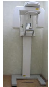
新しいデジトゲンです。

レントゲン(放射線)というと、それだけで拒否反応を示す方もいらっしゃいますが、そもそも自然界にも放射線は存在しそれに比べて、歯科の被ばく線量はごく少ないです。また、内科のものに比べて、従来の歯科のレントゲンでも被曝線量は少ないのですが、デジトゲンの場合は放射線の被曝線量が従来のレントゲン装置の1/10程度ですので、女性の方やお子様など安心して撮影することが出来ます。妊娠中の方でも安心です。