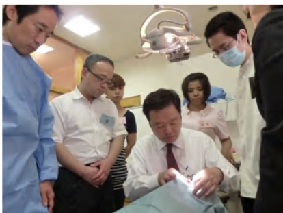
実際の診療台でインプラント 植立の説明

今まで頭で思っていたことだけでなく、実際のインプラント治療の現場で先生方が何に悩んでおられるのか？大分明らかになってきました。これからの講習会にこの情報を活かしたいと思っています。