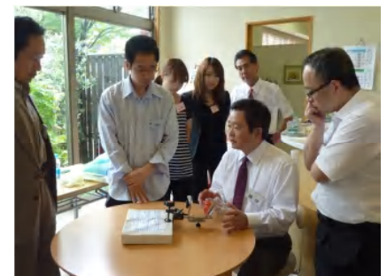
補助者の方との 連携についての説明