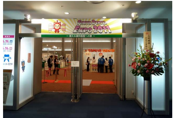
ロイヤルホテル横・国際会議場にて

年に1~2回、新しい知識を吸収する為に出掛けています。 歯科の新しい器材や薬剤など盛りだくさんで、ついつい色んなものを買ってしまい、妻からクレームの嵐でした。でも患者様に還元するのですからいいですよ。 院長